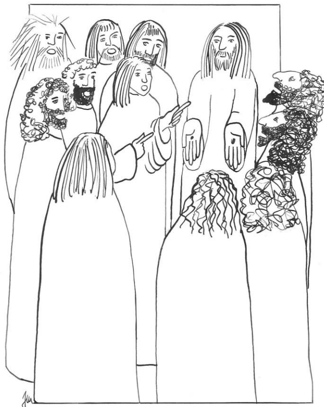
2. neděle velikonoční cyklu A Jan 20,19-31