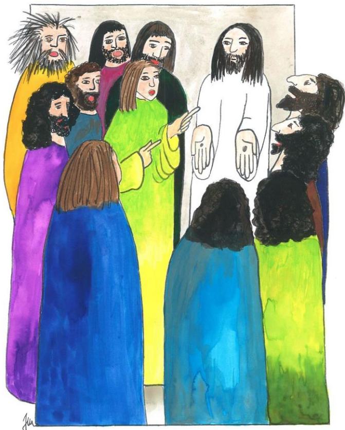
2. neděle velikonoční cyklu A Jan 20,19-31