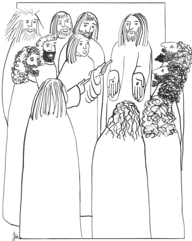
2. neděle velikonoční cyklu A Jan 20,19-31